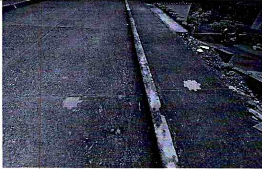
Imagen 3: Red principal