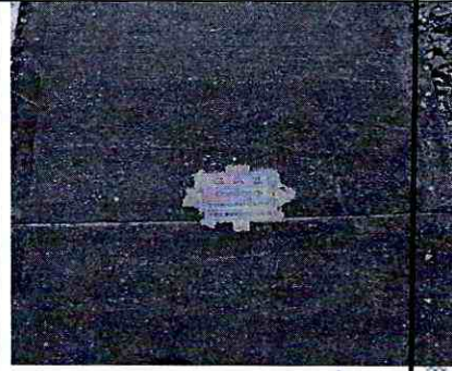
Imagen 4: válvula red principal