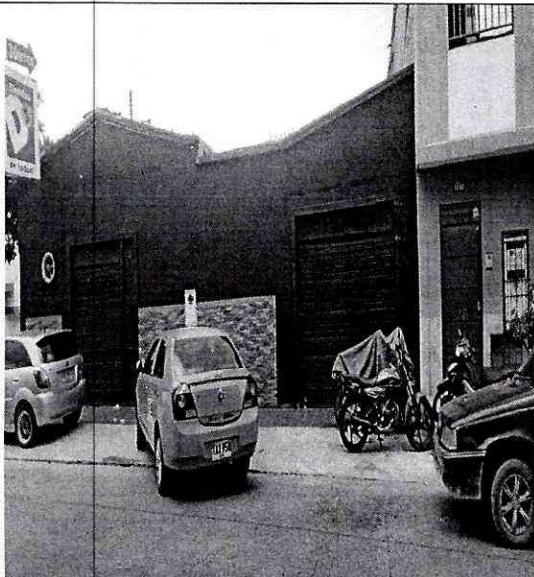
Imagen 1: Carrera 18 # 15-68 Barrio: San Francisco