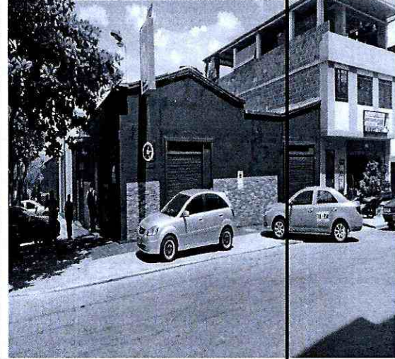
Imagen 4: Carrera 18 # 15-68 Barrio: San Francisco