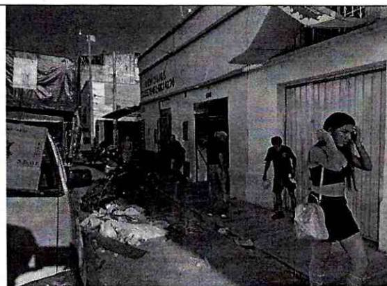
Imagen 2: PERFIL PREDIO