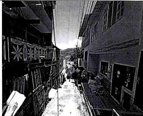
Imagen 2: Calle 26AN # 9-11 Barrio: Balcones del Kennedy