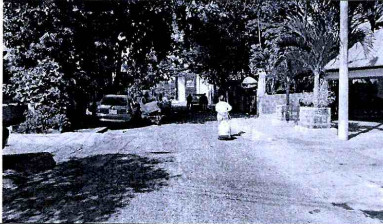
Figura N° 3: Carrera 3 # 24 - 76 Barrio: Girardot