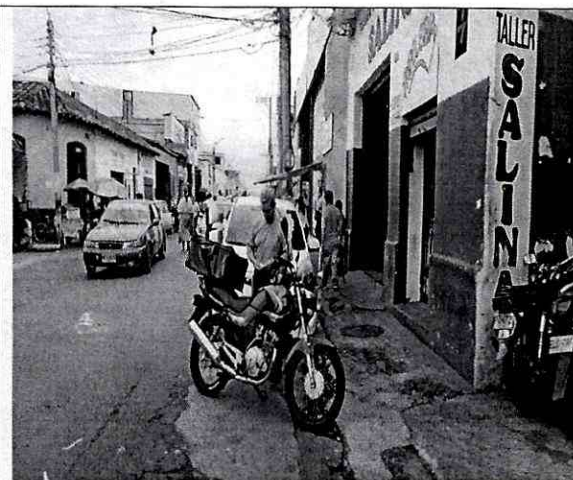
Imagen 2: Carrera 13 # 24 - 89 Barrio: Granada