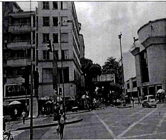
Imagen 1: Carrera 15 No 36-06 o calle 36 N° 14-42 local 1A Barrio: Centro