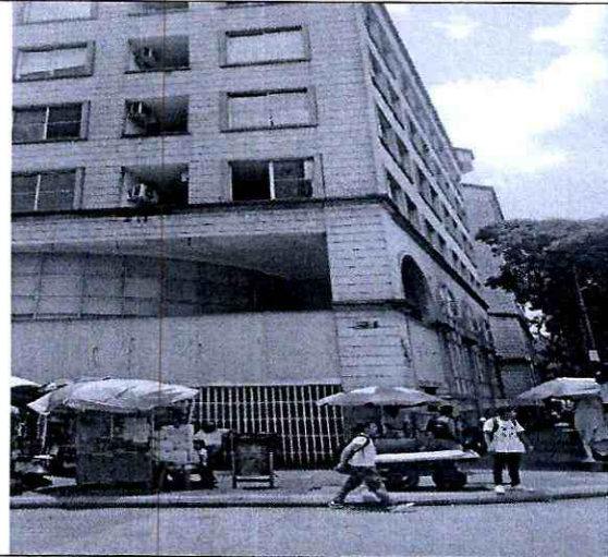
Imagen 3: Carrera 15 No 36-06 o calle 36 N° 14-42 local 1A Barrio: Centro