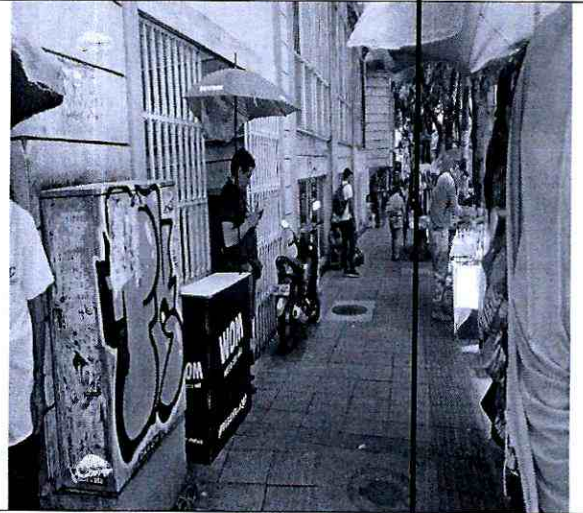
Imagen 4: Carrera 15 No 36-06 o calle 36 N° 14-42 local 1A Barrio: Centro