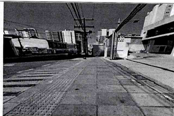
Imagen 2: PERFIL DEL PREDIO