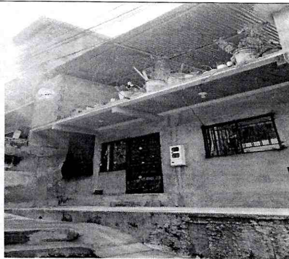
Imagen 2: Calle 28AN # 8A - 20 Barrio: Balcones del Kennedy