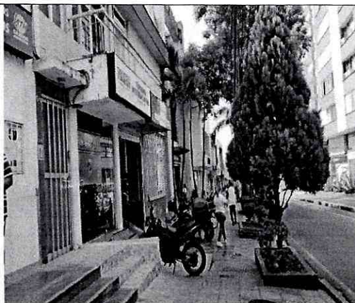
Imagen 2: carrera 35A # 51-19 piso 2 Barrio: Cabecera