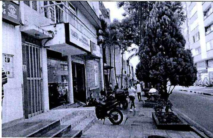
Imagen 3: carrera 35A # 51-19 piso 2 Barrio: Cabecera