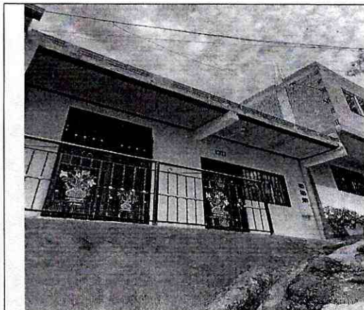
Imagen 1: FRENTE PREDIO