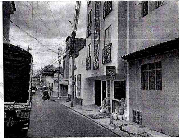
Imagen 2: PERFIL DEL PREDIO