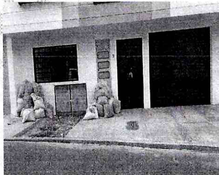
Imagen3: instalación acometida