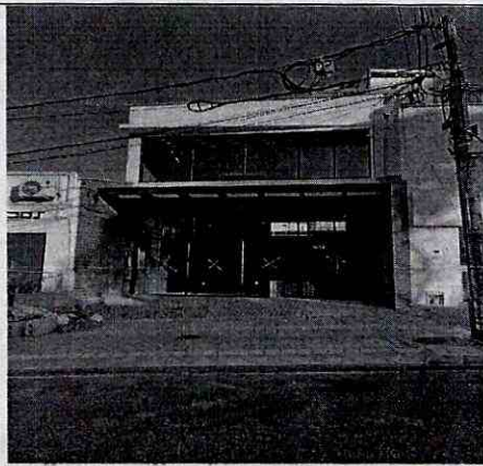
Imagen 1: FRENTE PREDIO