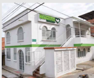
CENTROS DE SALUD