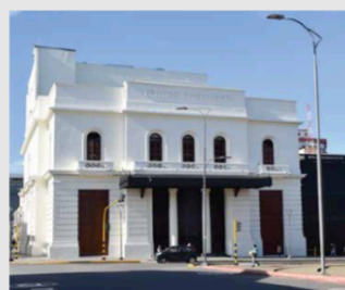
TEATRO SANTANDER, ESCENARIO DE TALLA INTERNACIONAL