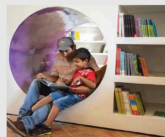
SALAS DE LECTURA