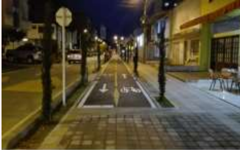
CARRERA 30 ENTRE CALLES 30 Y 32