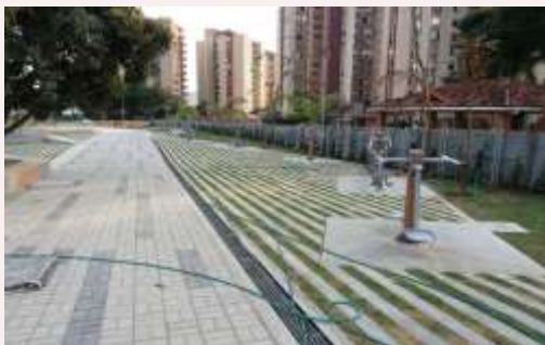
Eco gimnasios Bocapradera