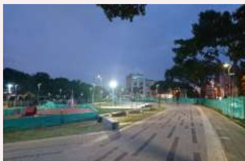
Andenes perimetrales, Zona Juegos y Bancas en concreto