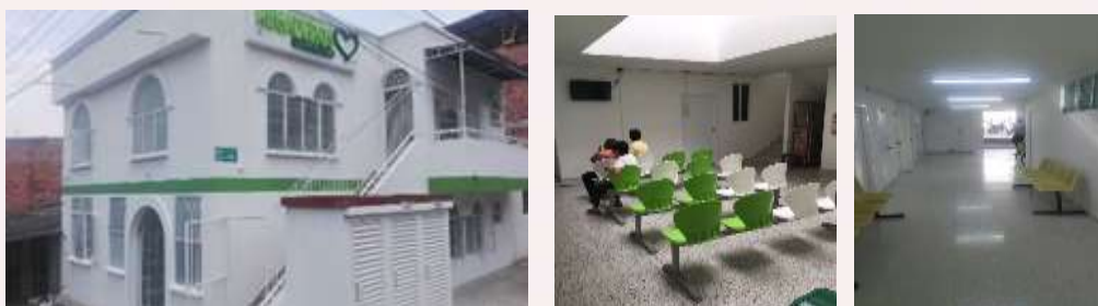
Fachada Principal puesto de salud de Regadero, Toledo Plata y Pablo sexto

Estado: Avance de obra: 100% - Recibido de Obra