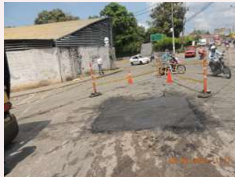
Después de la Intervención