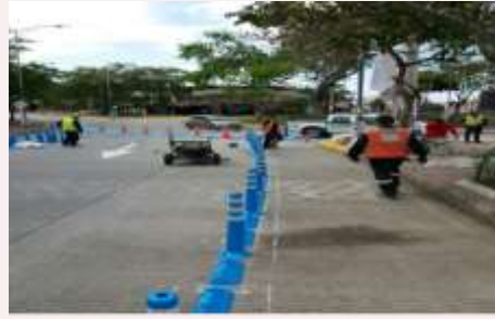
CARRERA 27 ENTRE UIS Y CABALLO DE BOLIVAR