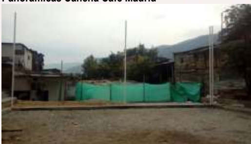
Panorámicas Cancha Café Madrid

La obra presenta un porcentaje de avance aproximado del 65% representado en Cancha la joya, reconstrucción de cerramiento, mantenimiento de la cubierta de la gradería adecuación de muros y cerramiento metálico, reposición de friso y piso de graderías. En Cancha de Café Madrid movimiento de tierra, construcción de filtro para manejo de aguas lluvia de la cancha, conformación de la superficie de la cancha, construcción de andenes perimetrales, adecuación de espacio para zona de juegos.