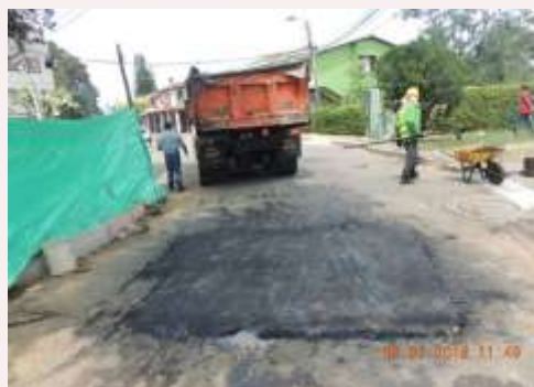
Después de la Intervención