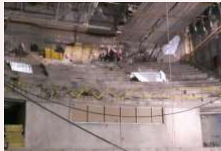
Tramoya y Camerino