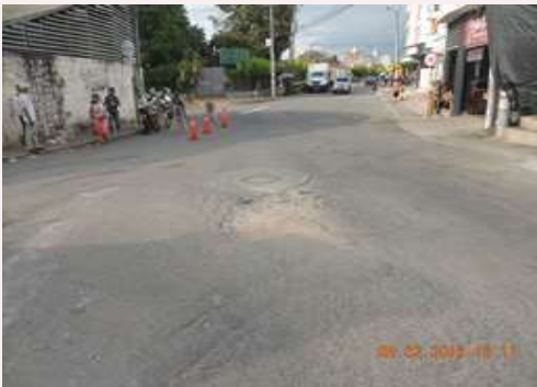
Antes de la Intervención Pavimento