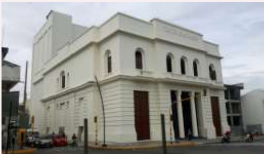
Fachada Teatro Santander

Se adelantó, por solicitud de la Fundación Teatro Santander adición en valor y plazo del convenio, con el fin de realizar actividades que puedan dar como resultado la apertura al público del Teatro Santander.