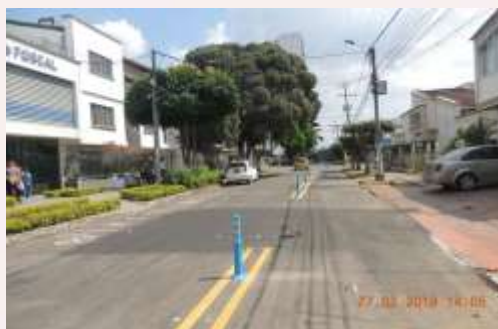
Después de la Intervención