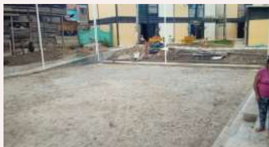
Panorámicas graderías la Joya y Cerramiento Forzado