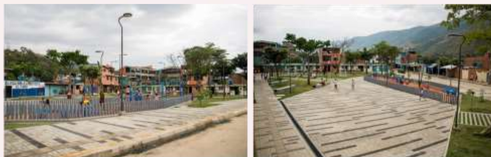
Anden perimetral costado occidental

Estado: Avance de obra: 100% - Recibido de Obra