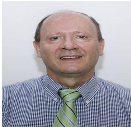
SECRETARIO DEL INTERIOR