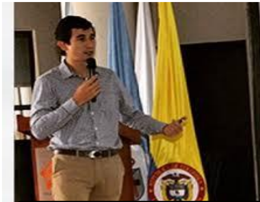
SUBSECRETARIO DEL INTERIOR

La Secretaría del Interior tiene dentro de su eje misional velar por la seguridad y la convivencia ciudadana en el Municipio, en consecuencia, centra sus esfuerzos en actividades que apunten a disminuir las conductas delictivas y generaciones para la resolución de conflictos, la convivencia y el fortalecimiento de la vigilancia en el ente territorial.