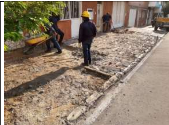
DEMOLICION ANDEN EXISTENTE