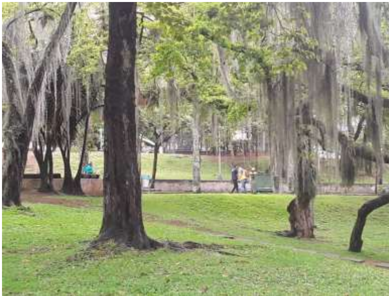
FOTOGRAFIA No. 2 Parque San Pio

Igualmente se encuentra en proceso de contratación mediante Licitación Pública No. SI-LP-006-2021, proyecto de "ACTIVIDADES DE PODA PARA EL DESPEJE DE LUMINARIAS Y REDES QUE INTERFIEREN CON EL ALUMBRADO PÚBLICO EN EL MUNICIPIO DE BUCARAMANGA Y TALA DE ÁRBOLES Y MANEJO INTEGRAL DEL