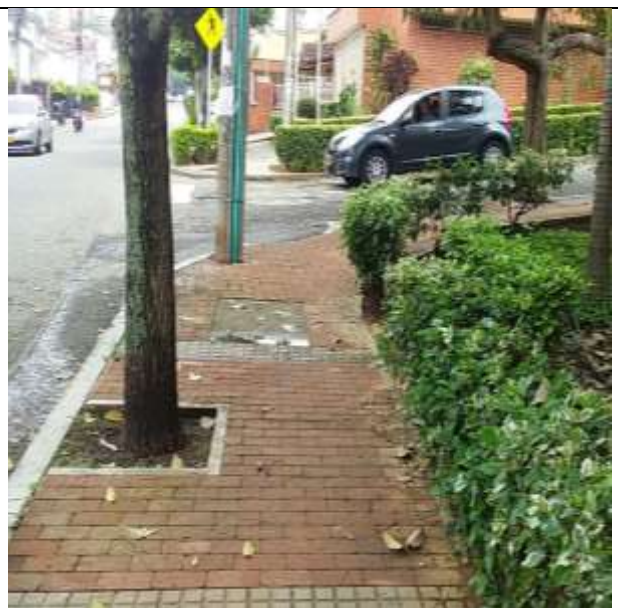
ESTADO INICIAL ESPACIO PUBLICO