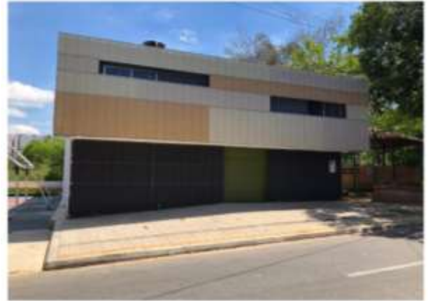
SALON COMUNAL BARRIO SAN MIGUEL