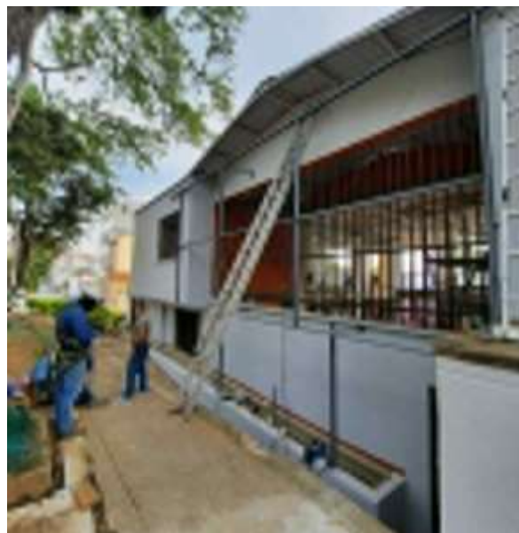
Pintura sobre Graniplast Fachada