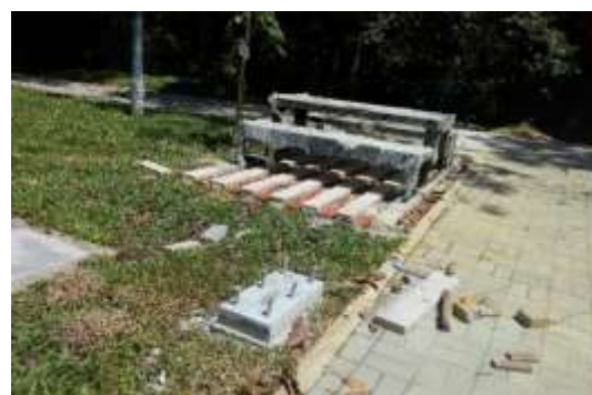
Instalación adoquín sendero y Mobiliario urbano.