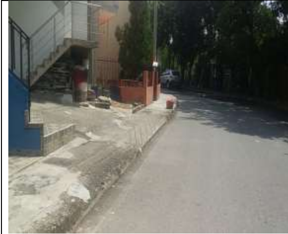
ESTADO INICIAL ESPACIO PUBLICO