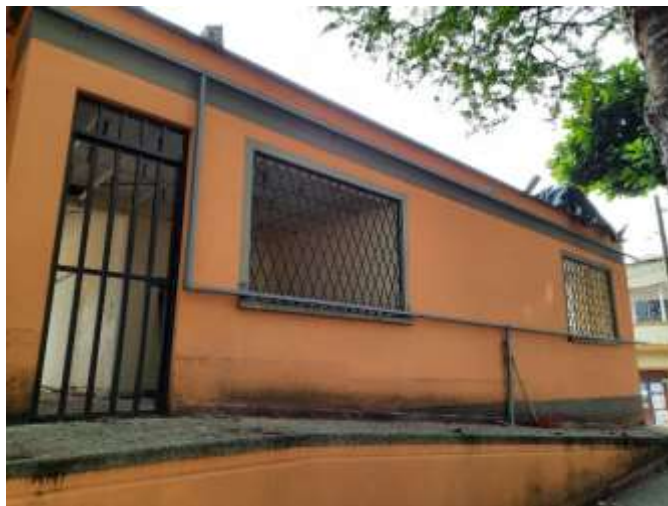
Instalación Estructura de Soporte de Fachada