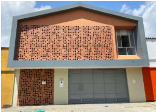
SALON COMUNAL BARRIO GAITAN