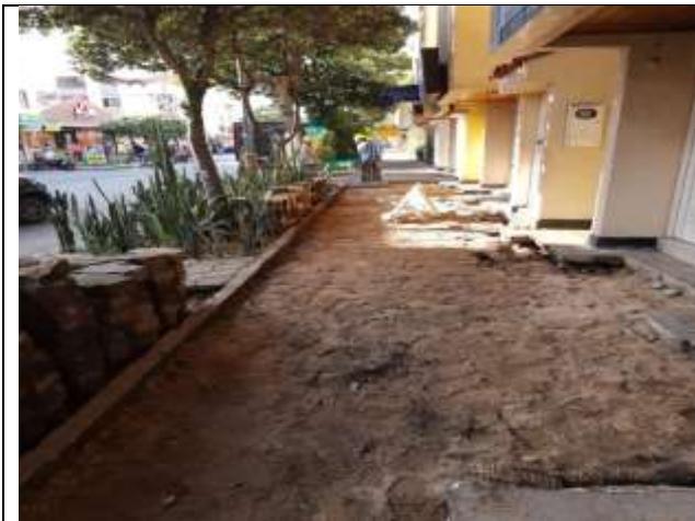
RETIRO ADOQUIN EXISTENTE