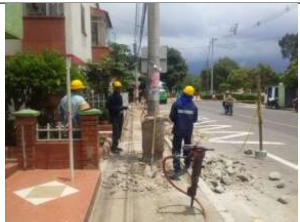
DEMOLICION ANDEN EXISTENTE