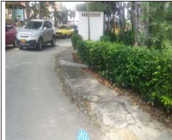
ESTADO INICIAL ESPACIO PUBLICO