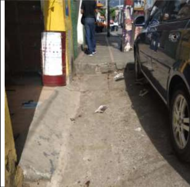
ESTADO INICIAL ESPACIO PUBLICO