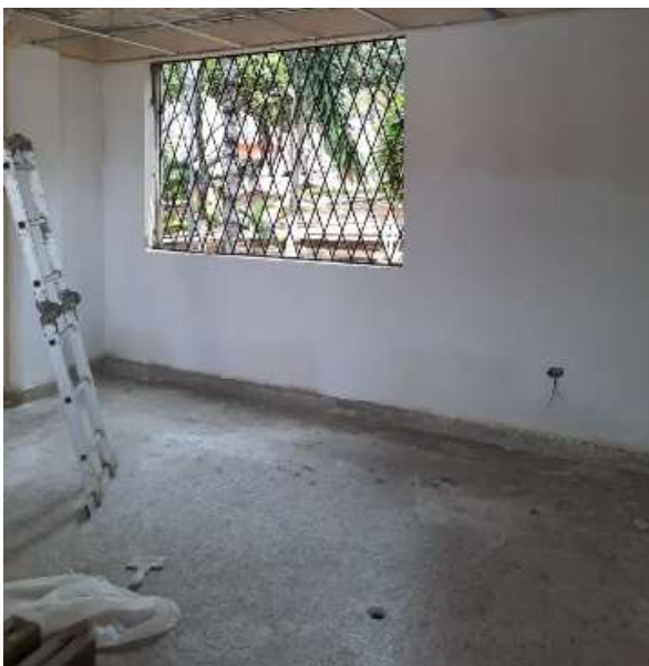
Estuco sobre muros interiores