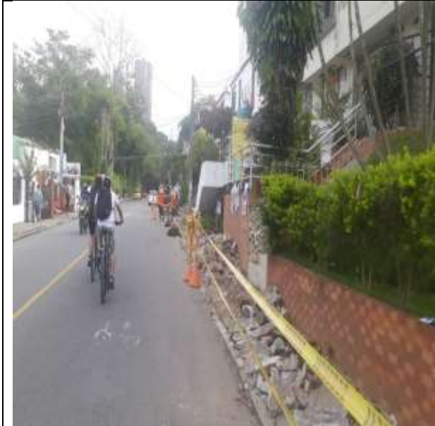
DEMOLICION ANDEN EXISTENTE