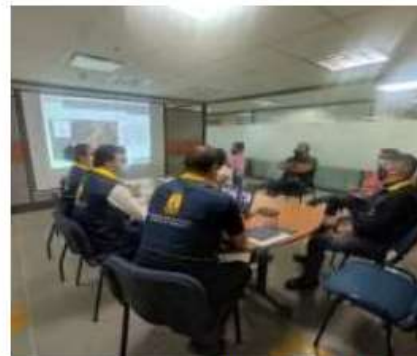
Reunion de en las instalaciones de la Alcaldía de Bucaramanga

De acuerdo con lo pactado en el convenio y en el acta anterior (Acta No 1 del 26 de febrero de 2021), se realiza seguimiento a los compromisos a cargo de la UNGRD: