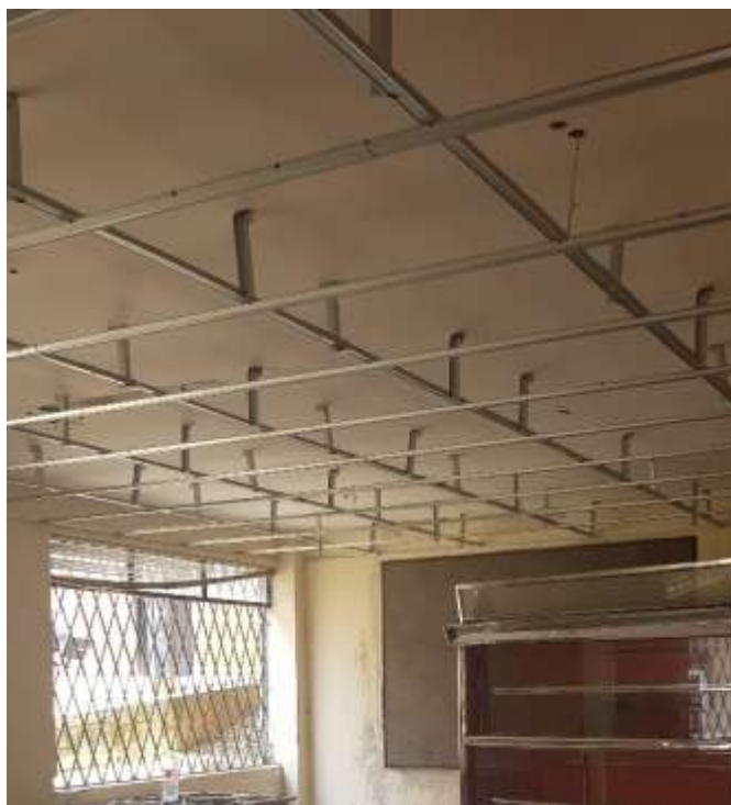
Instalación Estructura Cieloraso Primer Piso Area Panaderia