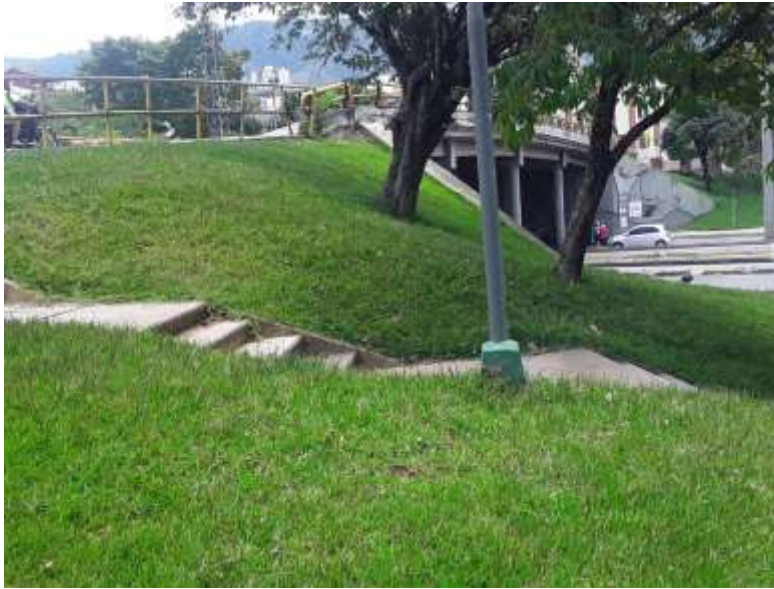
FOTOGRAFIA No. 1. Puente de Provenza.