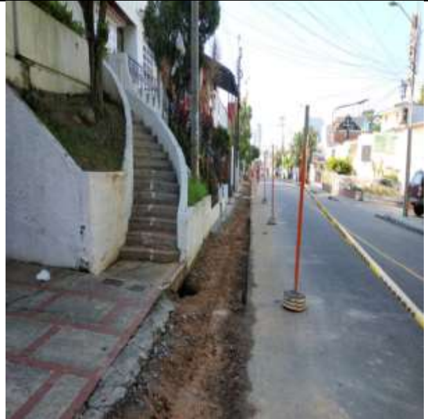
DEMOLICION ANDEN EXISTENTE