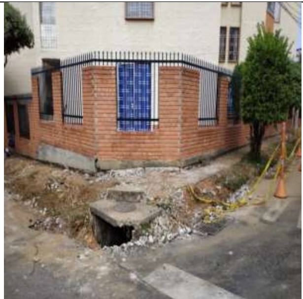
DEMOLICION ANDEN EXISTENTE