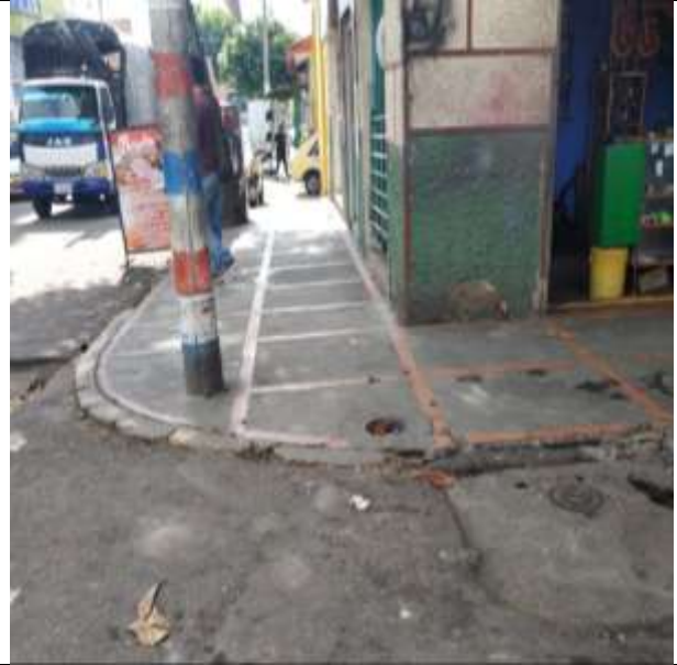
ESTADO INICIAL ESPACIO PUBLICO