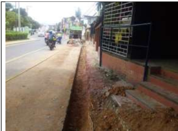
EXCAVACION MANUAL MATERIAL COMUN