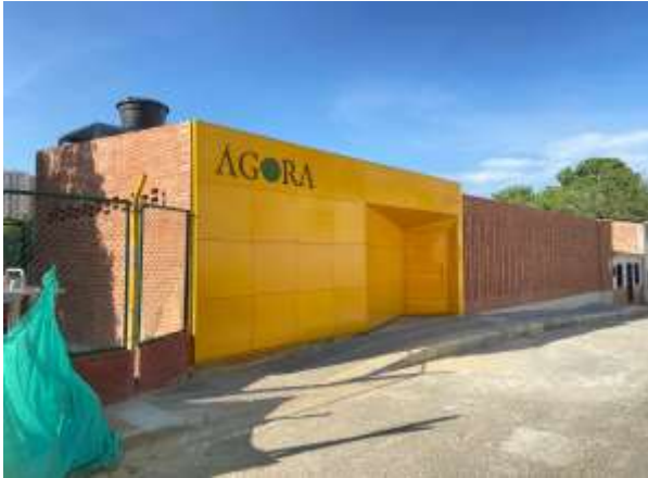
SALON COMUNAL BARRIO BUCARAMANGA