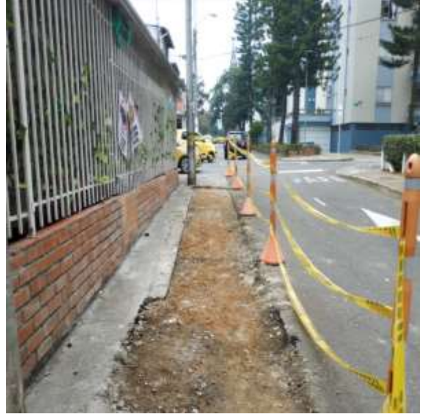
DEMOLICION ANDEN EXISTENTE