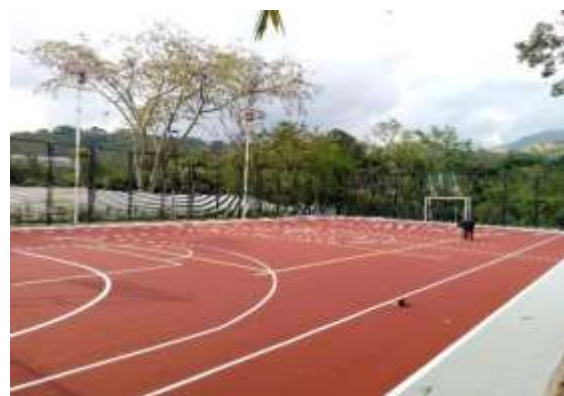
Pintura acrílica cancha múltiple zona 1.