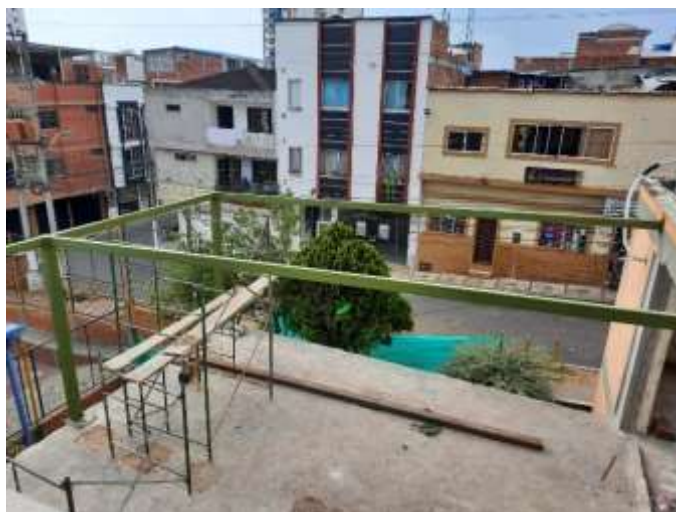
Instalación de Estructura en Area de Talleres 2do. Piso