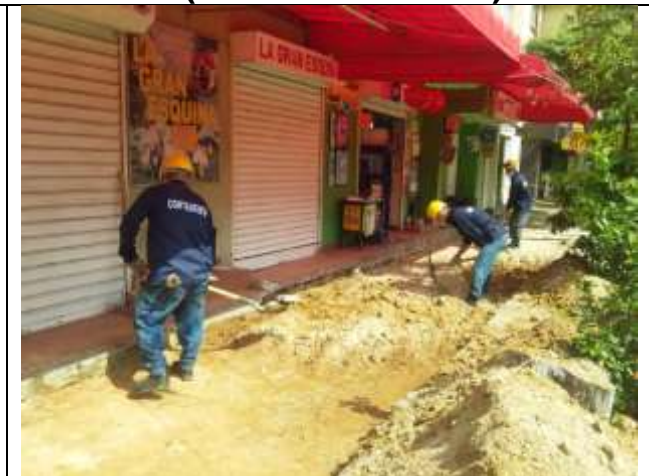
EXCAVACION MANUAL MATERIAL COMUN