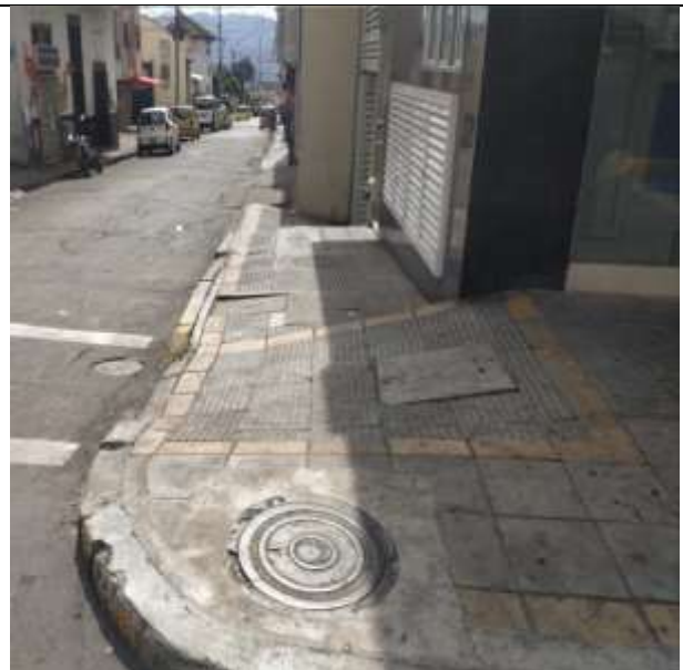
ESTADO INICIAL ESPACIO PUBLICO