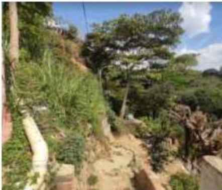
Sector GAITAN