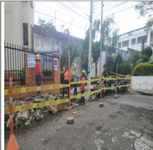
DEMOLICION ANDEN EXISTENTE