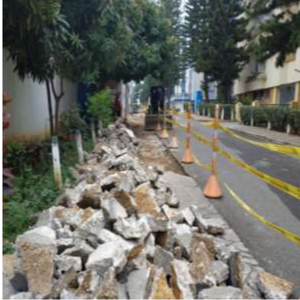
DEMOLICION ANDEN EXISTENTE