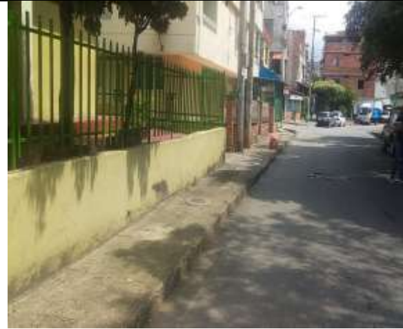
ESTADO INICIAL ESPACIO PUBLICO