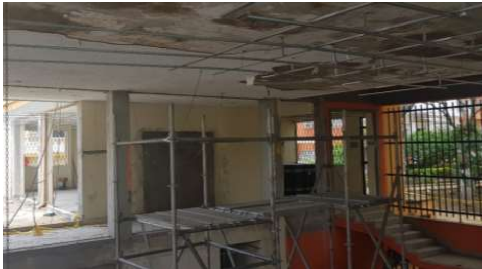
Instalación Estructura Cieloraso Area Central de Circulación Primer Piso

A la fecha, Se han ejecutado las Actividades preliminares. Se realizan simultáneamente las actividades de Obra Arquitectónica, Intervención de la fachada, Instalaciones eléctricas y de gas.