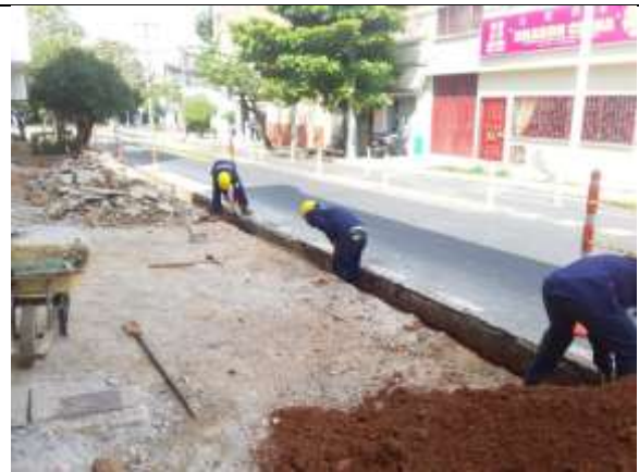
EXCAVACION MANUAL MATERIAL COMUN