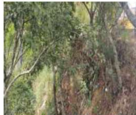
Sector CAMPOHERMOSO