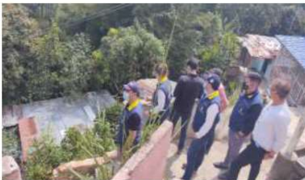
Recorrido a los sectores a intervenir