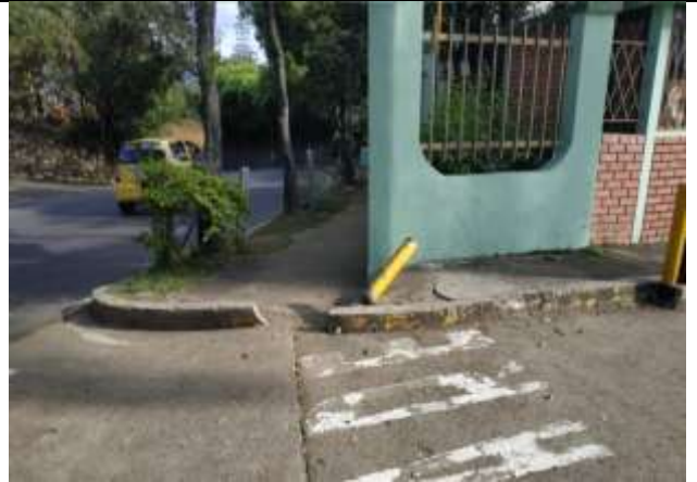
ESTADO INICIAL ESPACIO PUBLICO