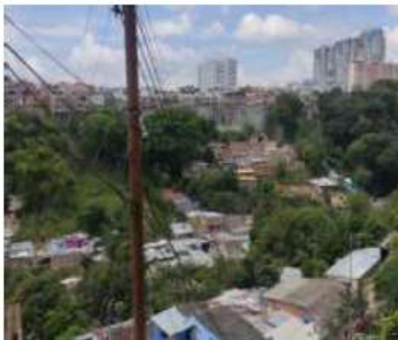
Sector SAN GERARDO