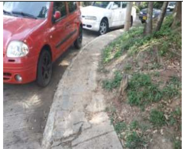
ESTADO INICIAL ESPACIO PUBLICO