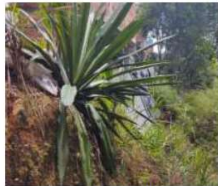
Sector DON BOSCO