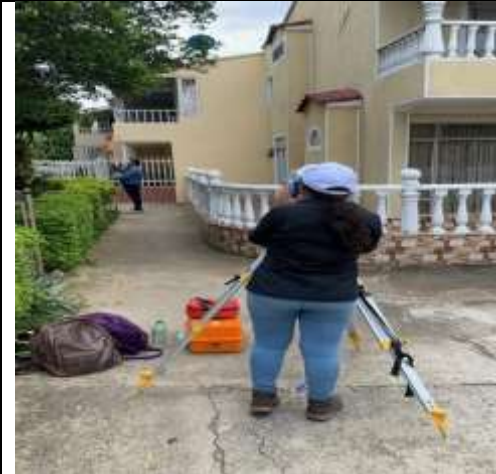
LEVANTAMIENTO TOPOGRAFICO DEL SECTOR