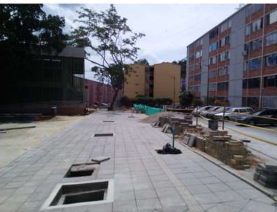
INSTALACIÓN LOSETA PREFABRICADA ACCESO PRINCIPAL