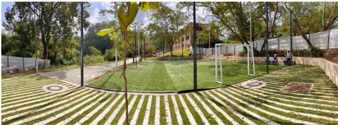
VISUAL ZONA CANCHA SINTÉTICA, ESTANCIAS URBANAS Y CIRCULACIONES PERIMETRALES SECTOR 3