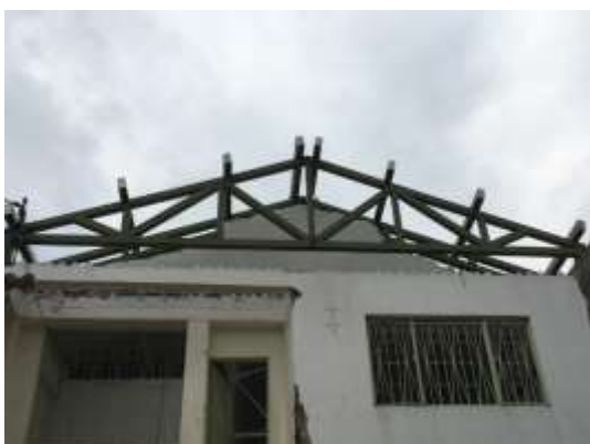
SALON COMUNAL BARRIO