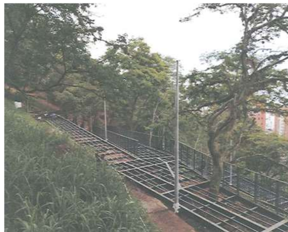
Suministro e Instalación plataforma de sendero