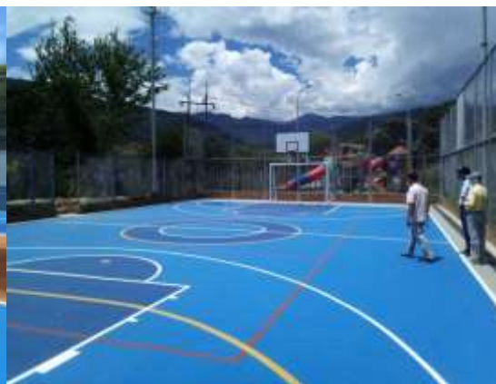
CANCHA MÚLTIPLE BARRIO VILLA