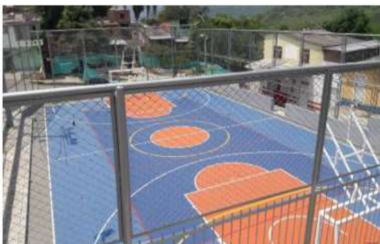
CANCHA MÚLTIPLE BARRIO LOS ÁNGELES