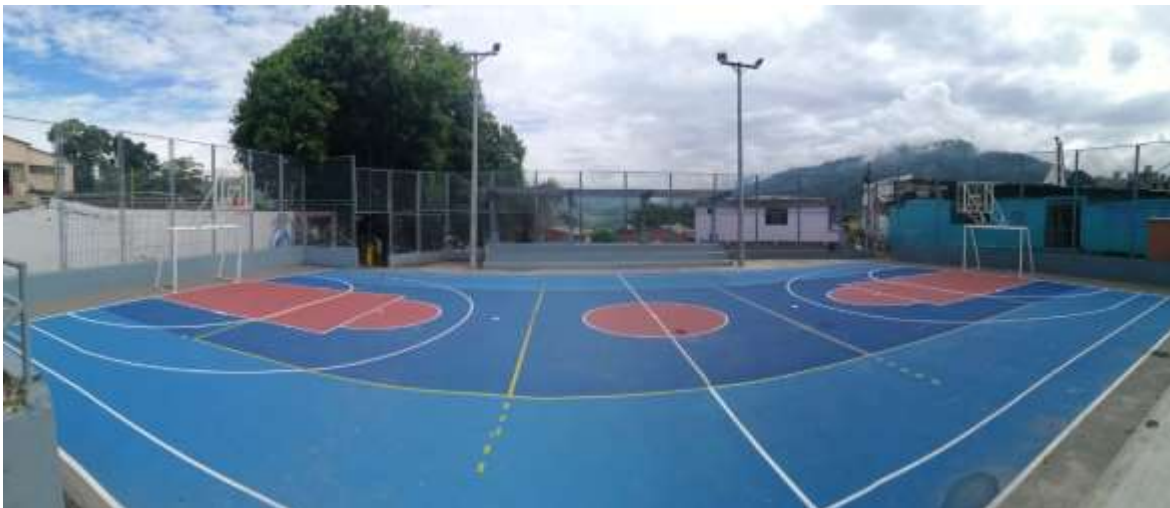
CANCHA MÚLTIPLE BARRIO ESPERANZA 1