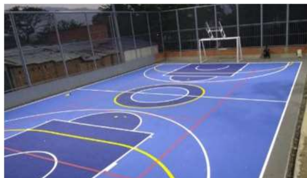
CANCHA MÚLTIPLE ASENTAMIENTO HUMANO NUEVO HORIZONTE