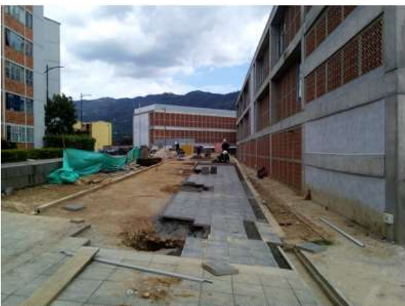
INSTALACIÓN LOSETA PREFABRICADA ZONA URBANA