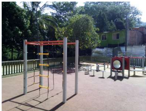
ZONA DE JUEGOS PARA NIÑOS SECTOR 3