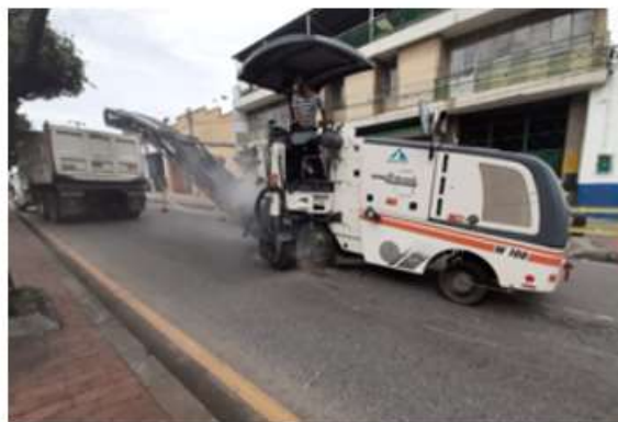
Fresado carrera 15 entre calle 6 y 8