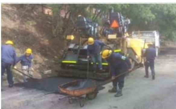
Calle 55 en Real de minas

Link: https://www.contratos.gov.co/consultas/detalleProceso.do?numConstancia=19-1-202047