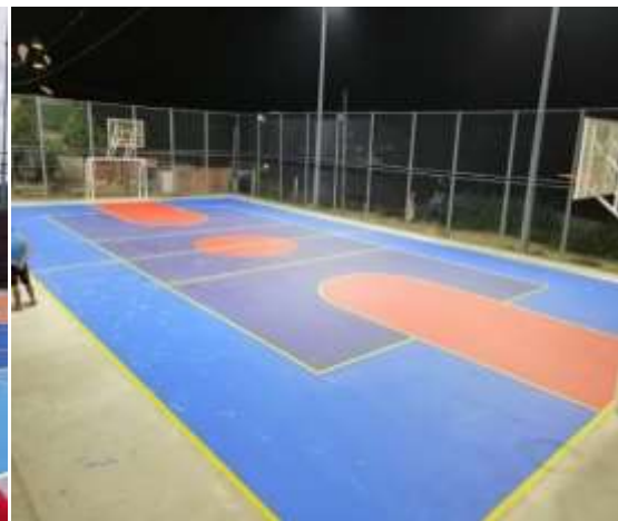
CANCHA MÚLTIPLE BARRIO VILLA MERCEDES