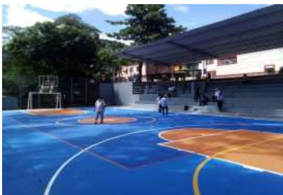
CANCHA MÚLTIPLE BARRIO VILLA HELENA 2