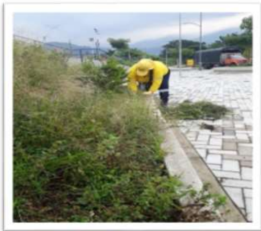
Parque Lineal Rio de Oro