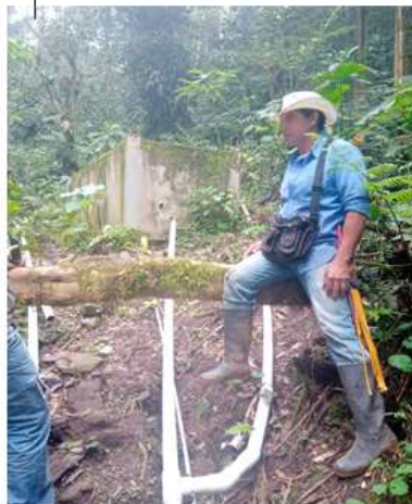
Vereda Magueyes línea de aducción al desarenador