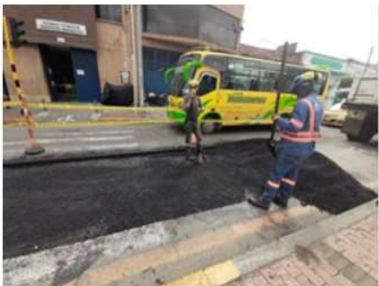
Aplicación asfalto carrera 15 No 21- 72