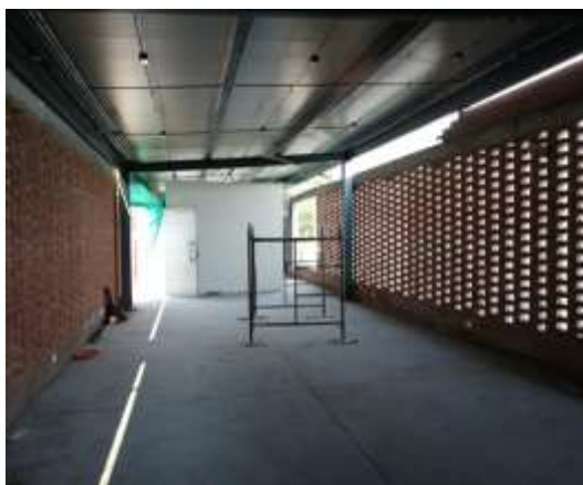
SALON COMUNAL BARRIO BUCARAMANGA