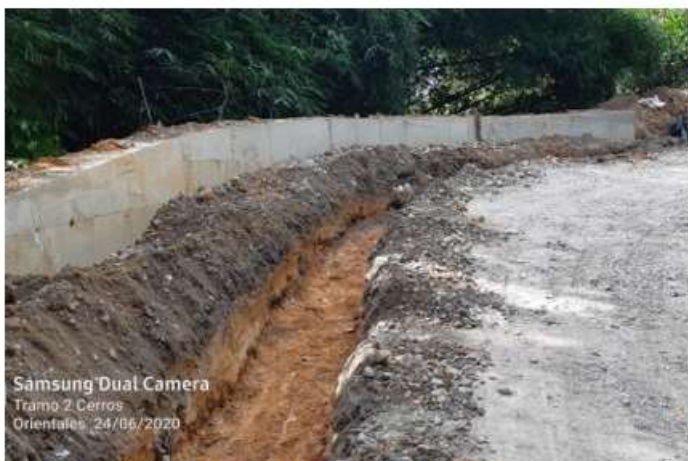
Excavación manual para ductería eléctrica

Link: https://www.contratos.gov.co/consultas/detalleProceso.do?numConstancia=19-21-10760