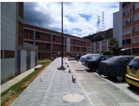
INSTALACIÓN LOSETA PREFABRICADA ZONA URBANA