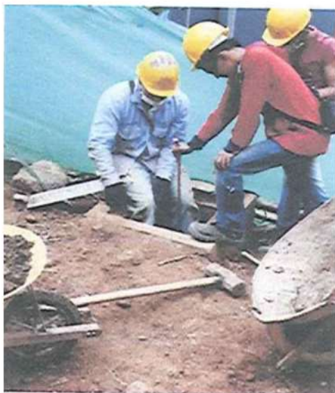
Instalación de puesta tierra (varilla cooperwell)