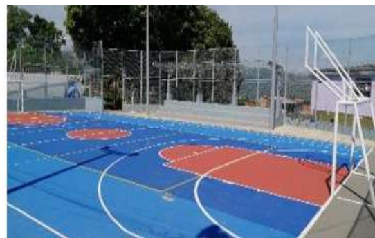
CANCHA MULTIPLE BARRIO ESPERANZA 1