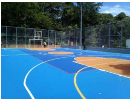
CANCHA MÚLTIPLE BARRIO VILLA ROSA SECTOR 4,5 Y 6