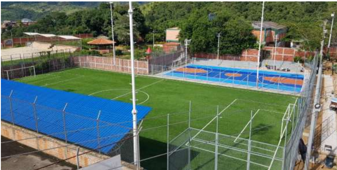
CANCHA DE FÚTBOL EN GRAMA SINTETICA B. MARÍA PAZ