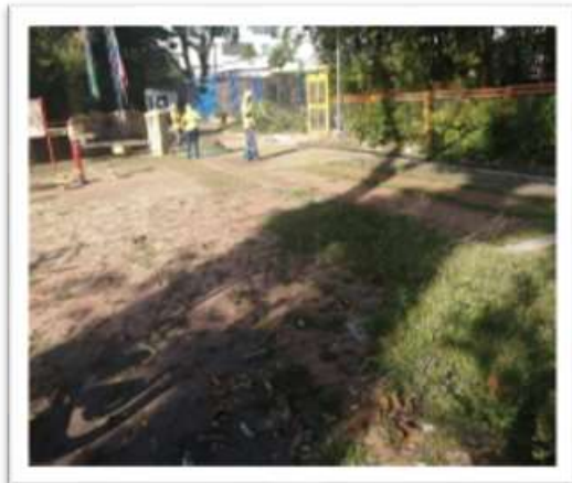
Parque Carlos Enrique Virviescas