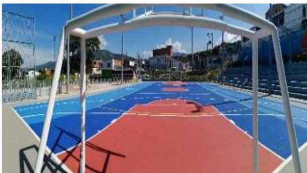
CANCHA MULTIPLE BARRIO SAN CRISTOBAL

Link: https://www.contratos.gov.co/consultas/detalleProceso.do?numConstancia=19-1-199485