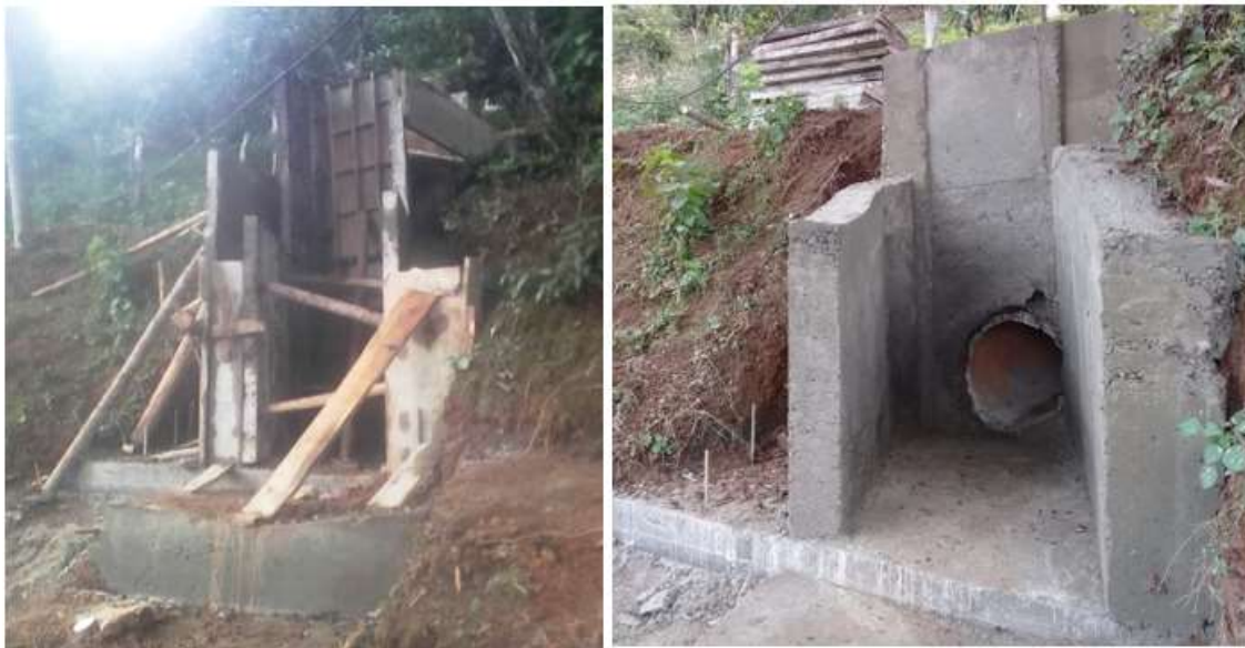
CONSTRUCCION ALCANTARILLA VEREDA LA SABANA