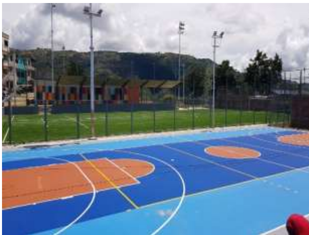
CANCHA MÚLTIPLE BARRIO MARÍA PAZ