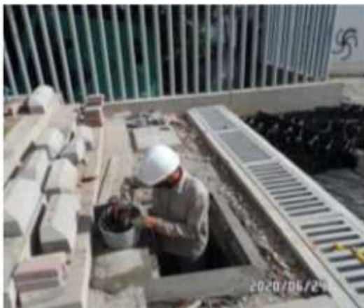
Ajuste niveles de tapas de cajas eléctricas

Link: https://www.contratos.gov.co/consultas/detalleProceso.do?numConstancia=19-21-10760