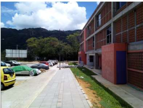
INSTALACIÓN LOSETA PREFABRICADA ACCESO AL CDI