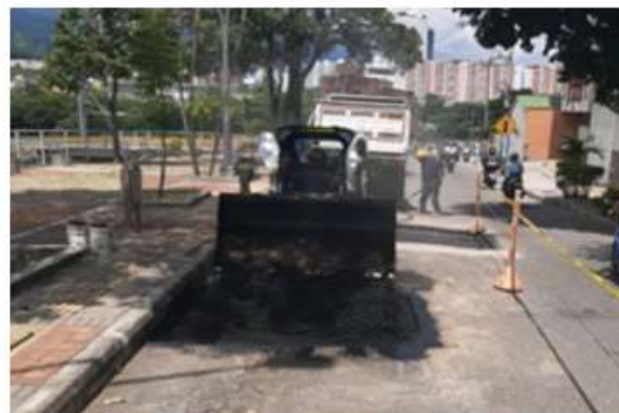
Carrera 30 con calle 65, Puerta del Sol