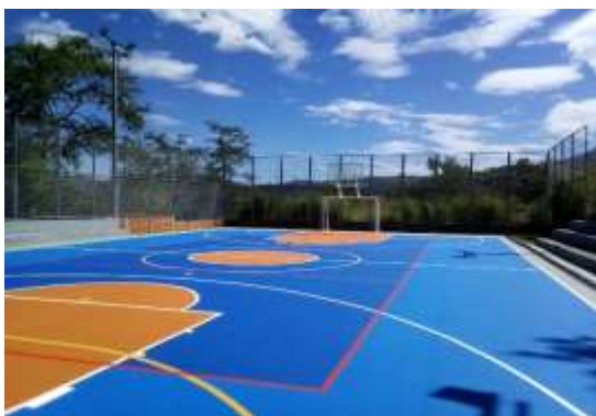
CANCHA MÚLTIPLE BARRIO VILLA HELENA 1