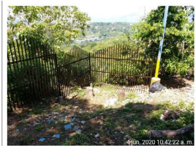
Elaboración e instalación de cerramiento en anticorrosivo y esmalte en tubo de 2"