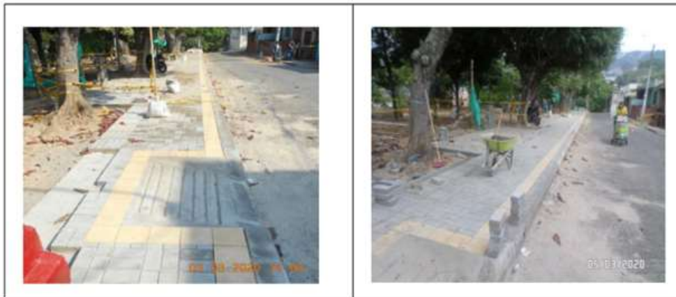
Piso adoquín demarcador visual amarillo