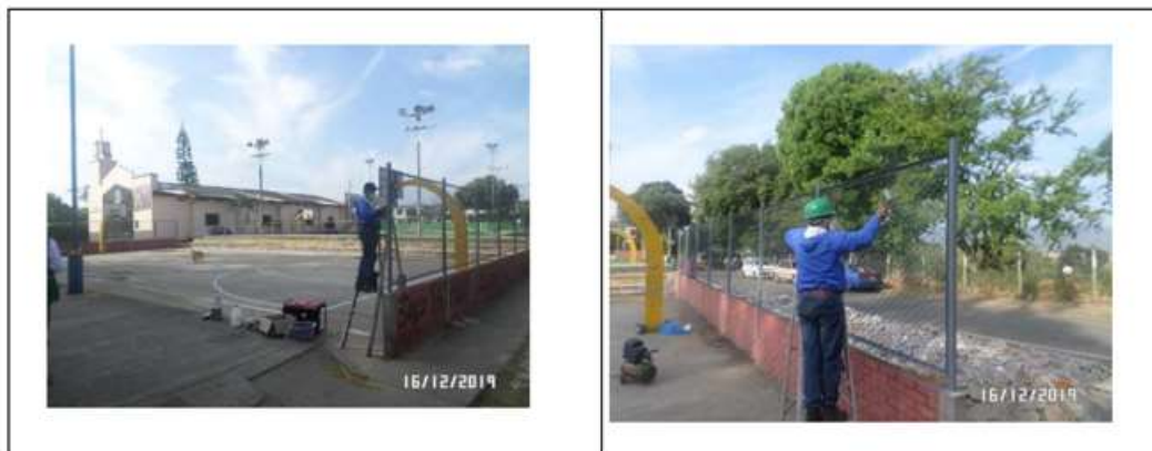
Mantenimiento de pintura de módulo de cerramiento en malla eslabonada