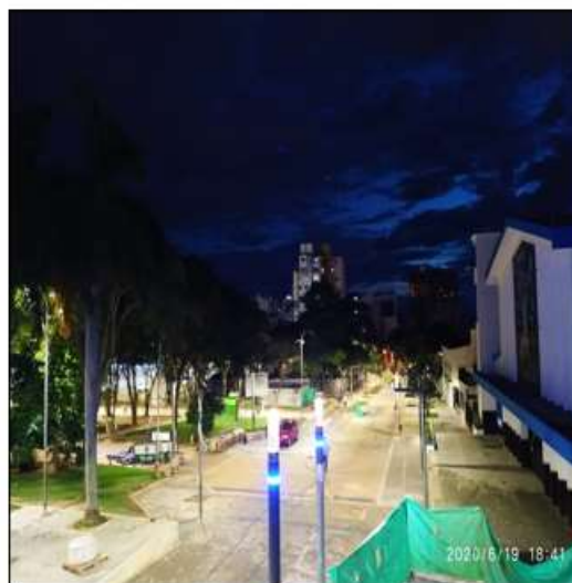
Pruebas de iluminación calle 30, parque de los niños frente a la Biblioteca Gabriel Turbay