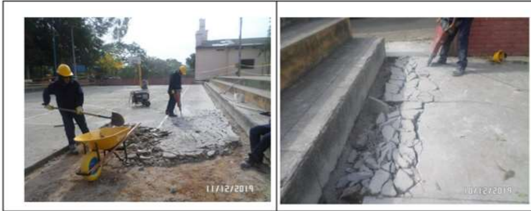
Demolición de piso