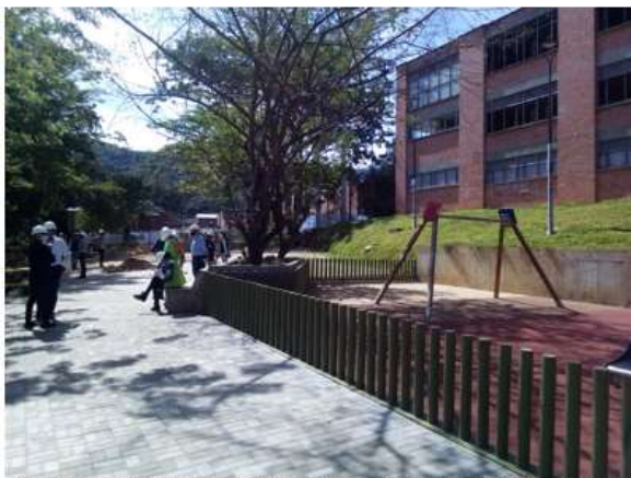
ZONA DE CIRCULACIÓN Y JUEGOS PARA NIÑOS SECTOR 3