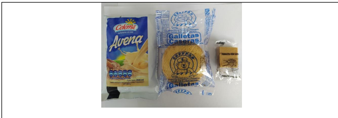
Menú 9. Avena, Galleta Casera, Panelita.