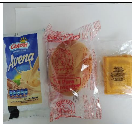
Menú 5. Avena, Croissant, Bocadillo.