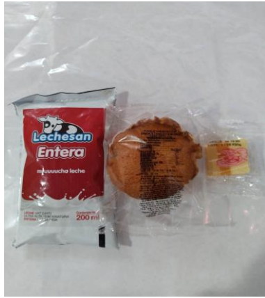
Menú 1: Leche entera UHT, Ponqué Variedad con sabor Canela Manzana y Caramelo.

Fecha: (d-m-a) 12 06 2020 LUGAR Bodega Grupo 1