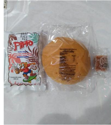
Menú 2: Leche Saborizada UHT, Pan Variedad Mantequilla, Rollito de guayaba.