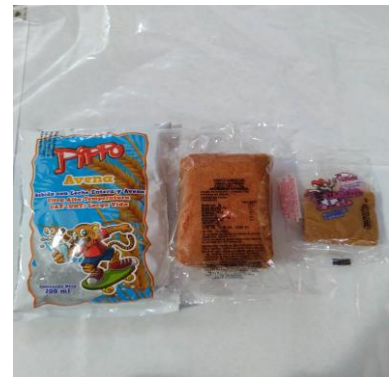
Menú 4: Avena, Torta variedad Vainilla Fresa, Panelita de leche.