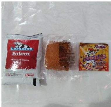
Menú 3: Leche entera UHT, Mantecada, Arequipe.