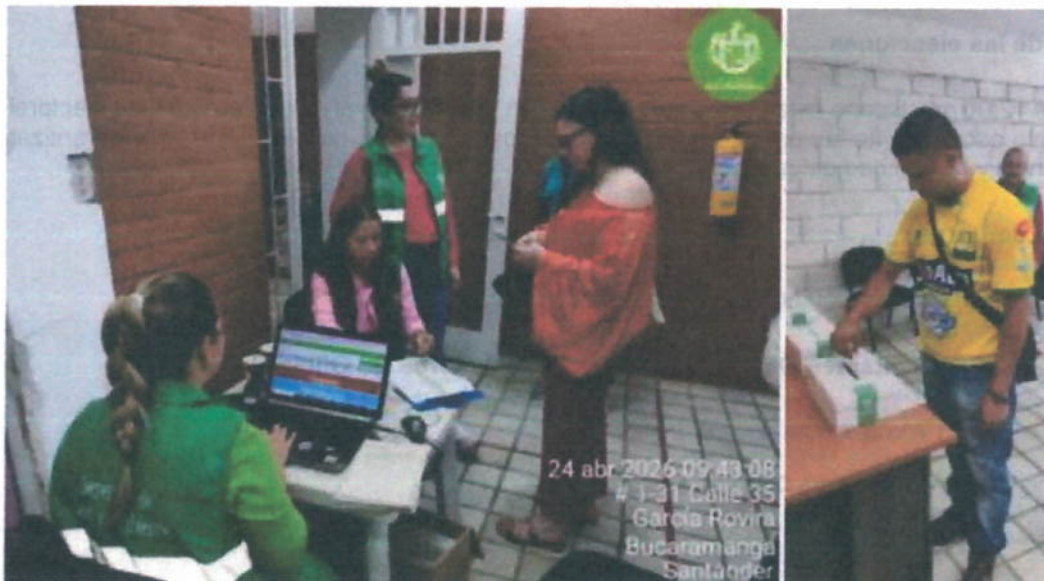
Evidencia 2. Jornada de elecciones

Se presentaron dos votantes representantes de las universidades