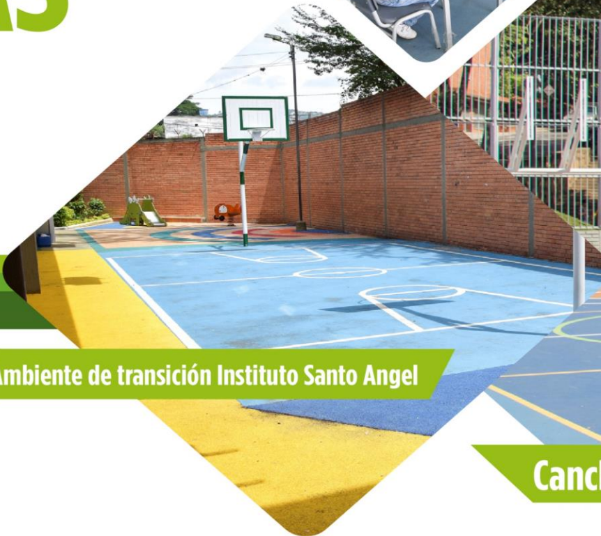
Ambiente de transición Instituto Santo Angel