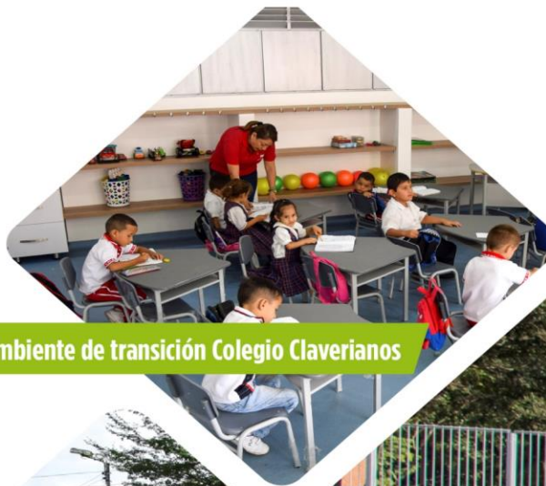
Ambiente de transición Colegio Claverianos