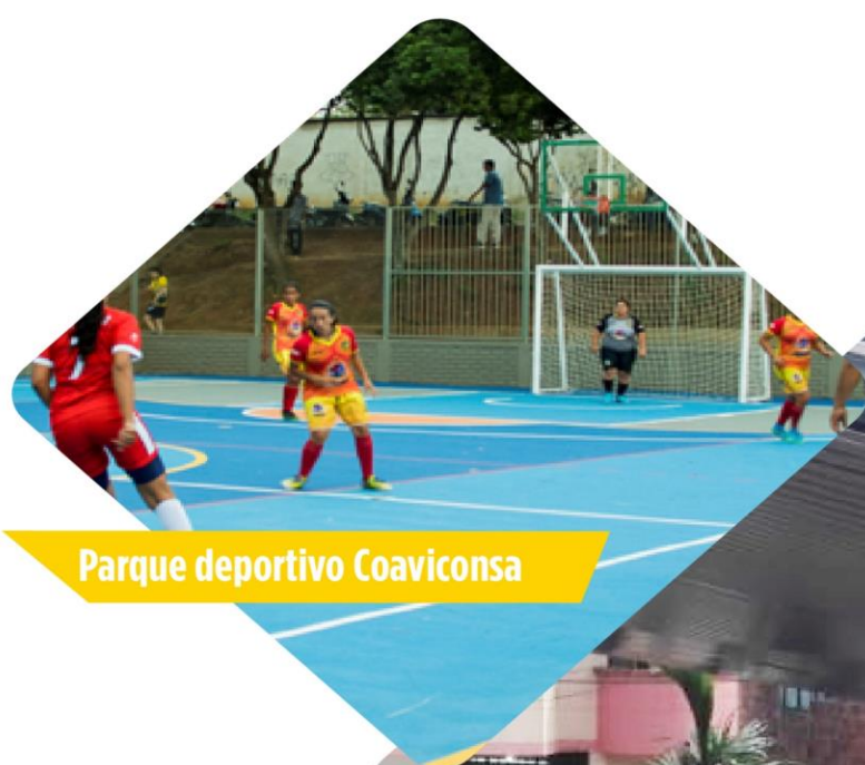
Parque deportivo Coaviconsa