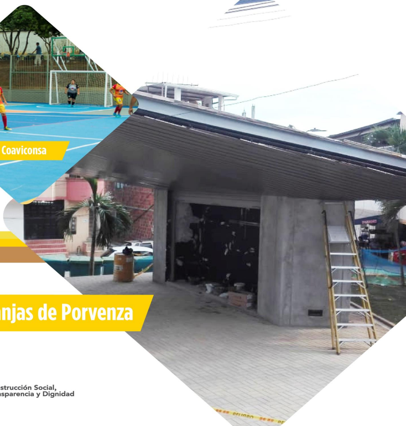
Parque Granjas de Porvenza

INFORME DE OBRAS PUBLICAS PRIMER TRIMESTRE - 2019