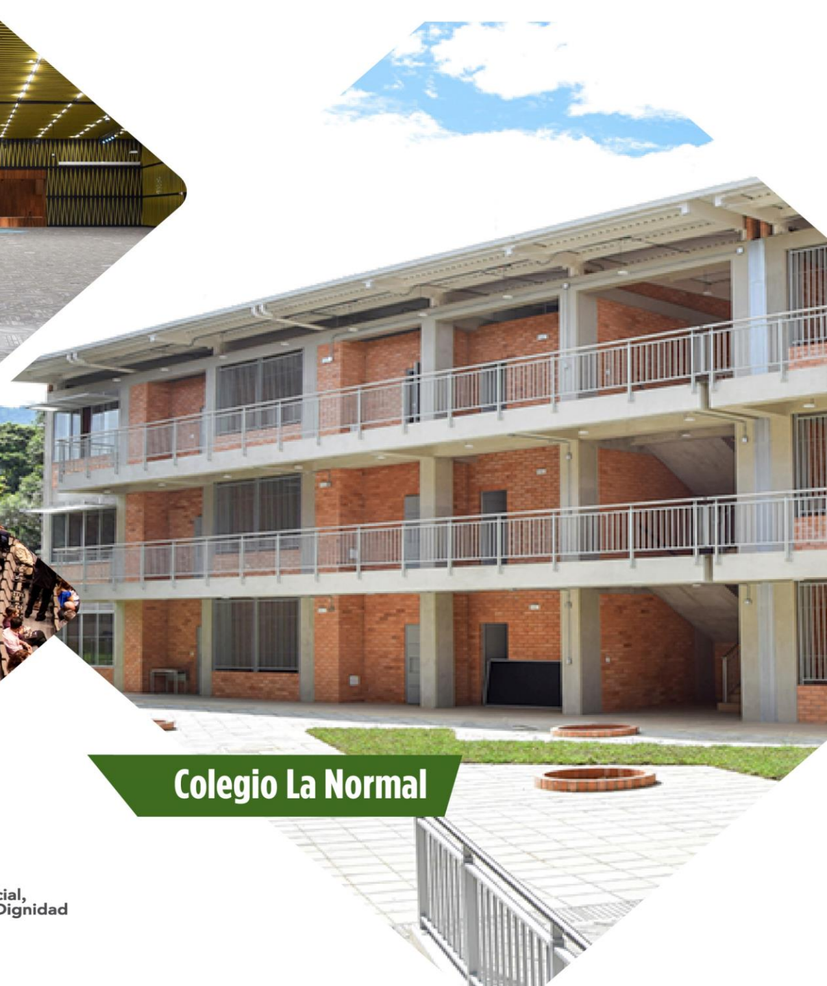
Colegio La Normal

INFORME DE OBRAS PUBLICAS PRIMER TRIMESTRE - 2019