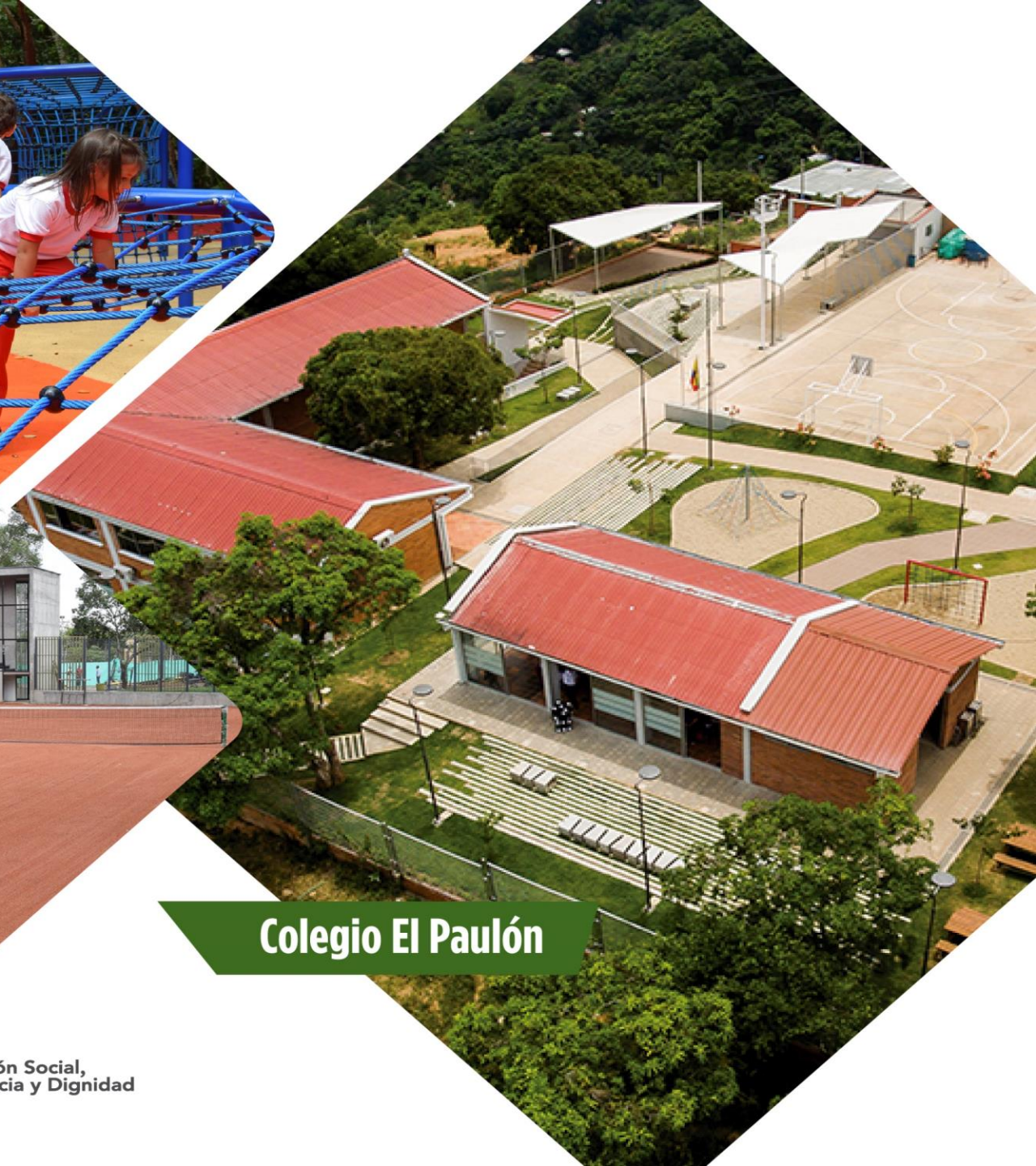
Colegio El Paulón

INFORME DE OBRAS PÚBLICAS PRIMER TRIMESTRE - 2019