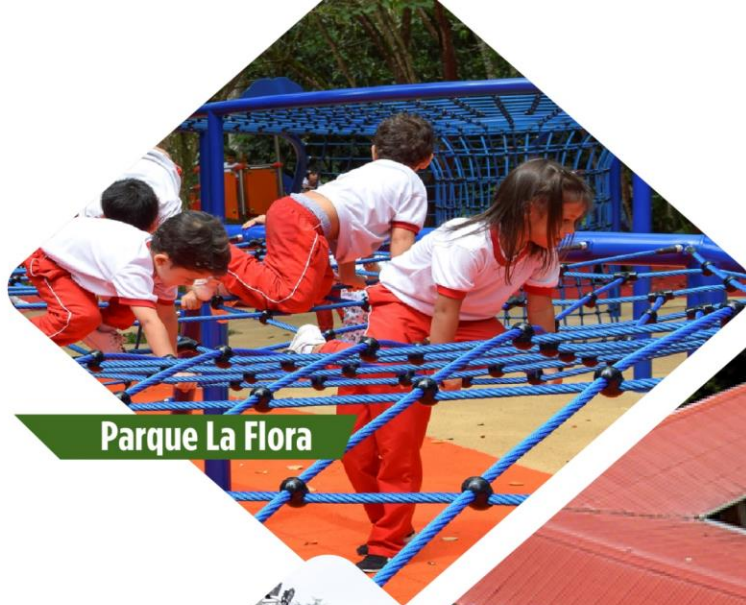
Parque La Flora