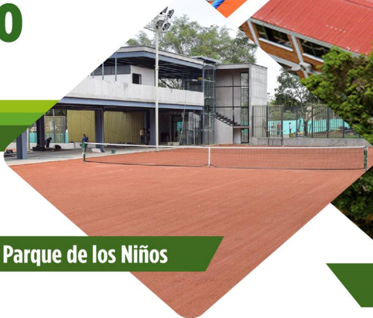
Club de Tenis Parque de los Niños