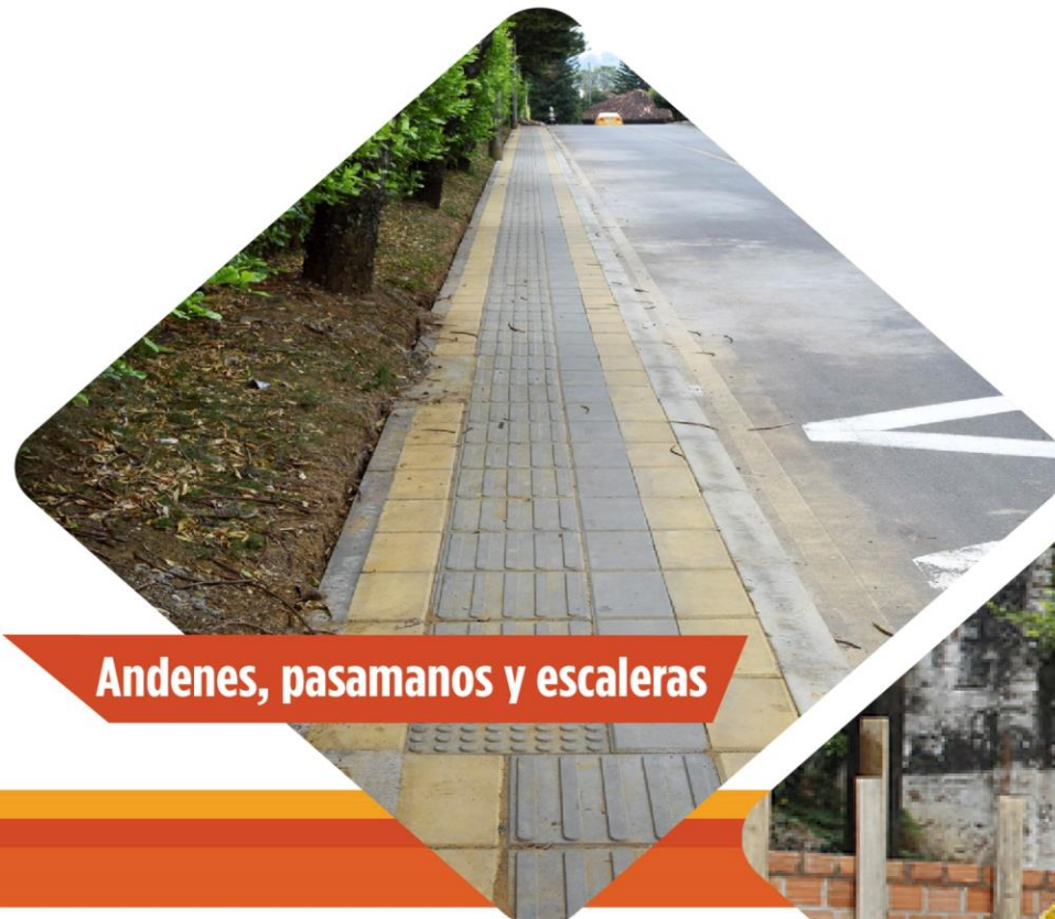
Andenes, pasamanos y escaleras