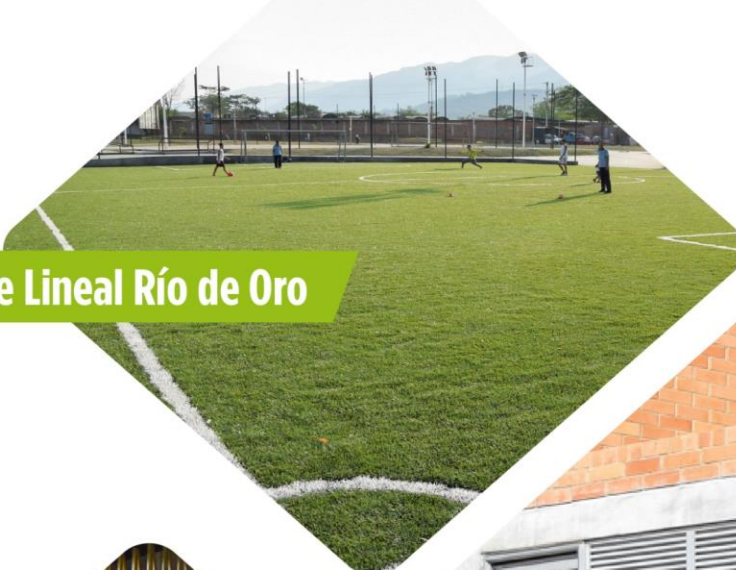
Parque Lineal Río de Oro