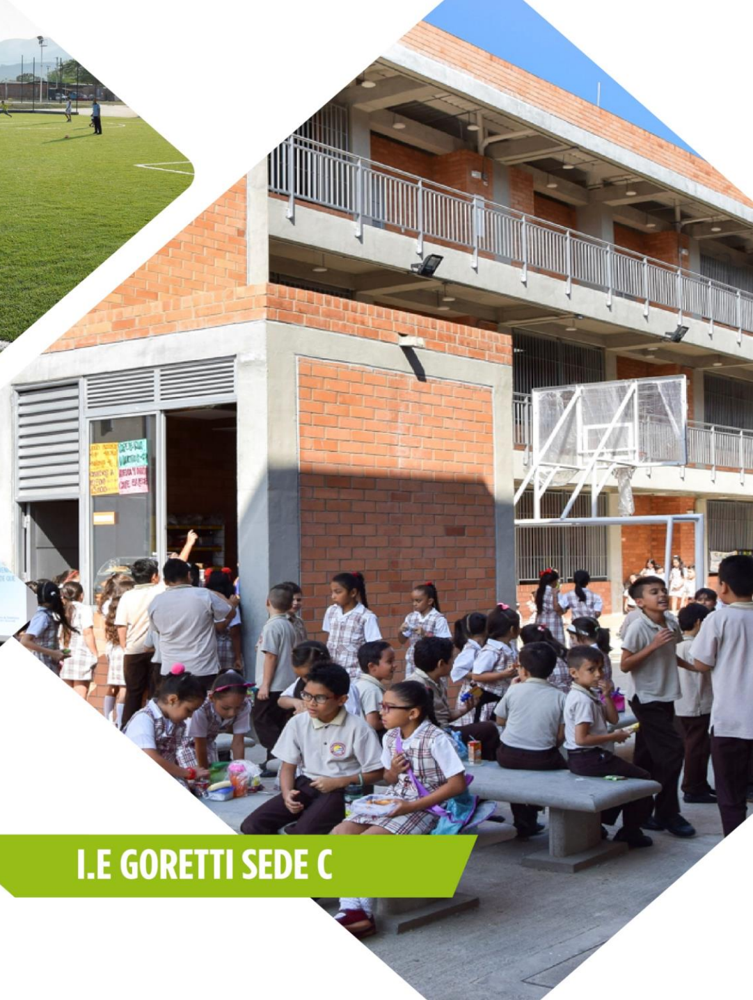
I.E GORETTI SEDE C

INFORME DE OBRAS PÚBLICAS PRIMER TRIMESTRE - 2019