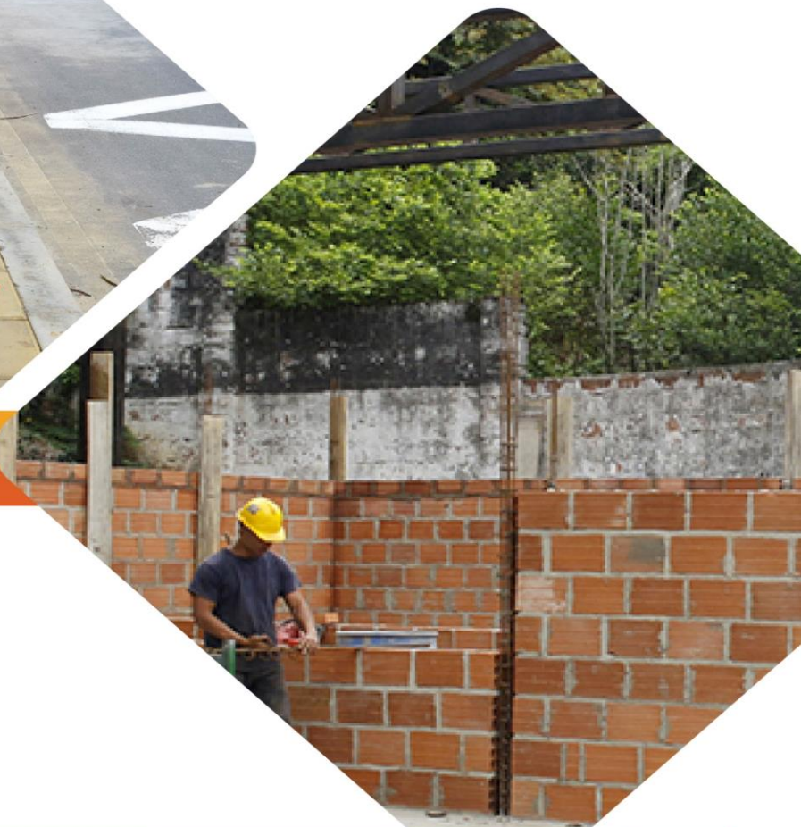
Mantenimiento Colegio Bicentenario

INFORME DE OBRAS PUBLICAS PRIMER TRIMESTRE - 2019