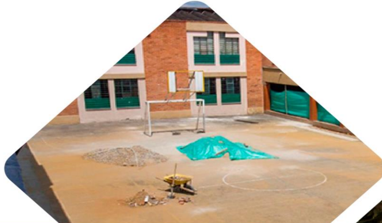
Repotenciación - Colegio Aurelio Martínez