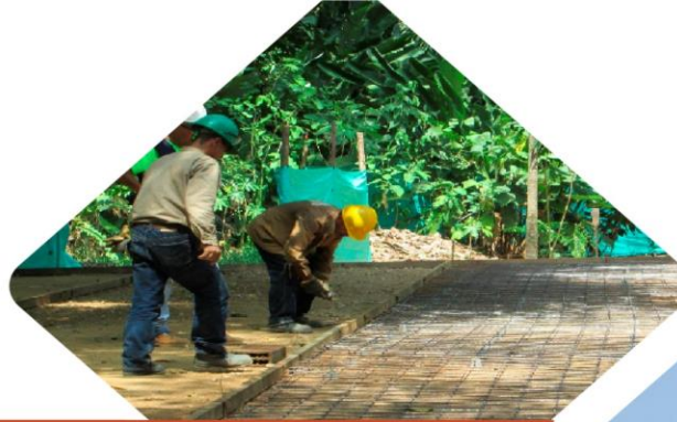
Repotenciación - Parque La Flora