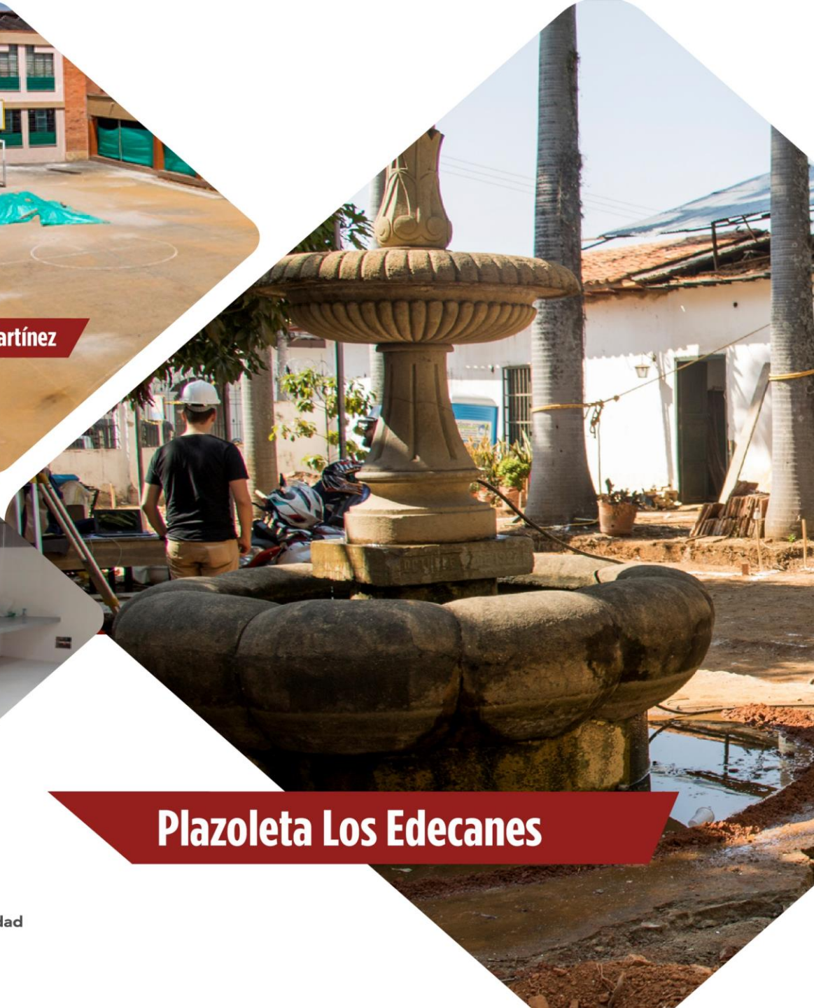
Plazoleta Los Edecanes

INFORME DE OBRAS PUBLICAS CUARTO TRIMESTRE