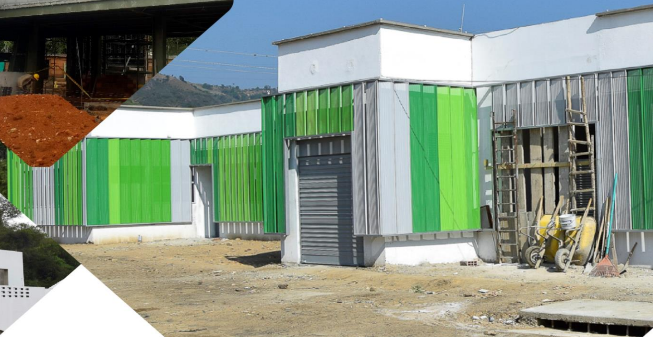
Centro de salud Café Madrid

INFORME DE OBRAS PUBLICAS CUARTO TRIMESTRE