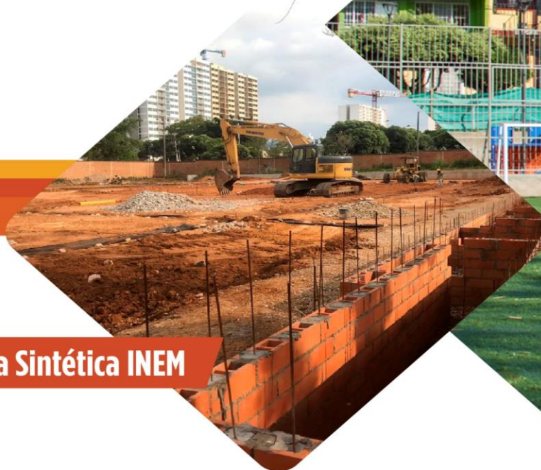
Cancha Sintética INEM