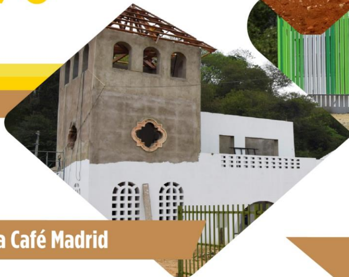
Ludoteca Café Madrid