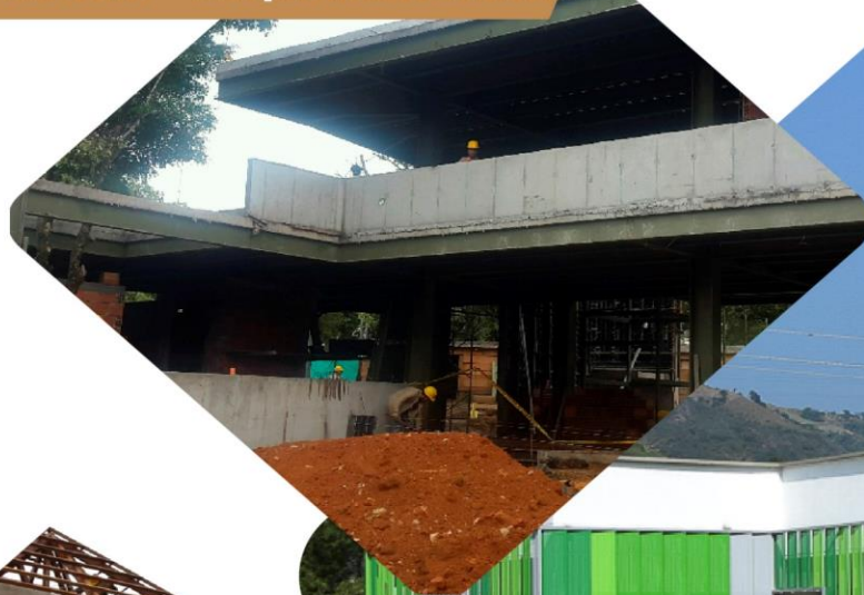
Club de tenis - Parque de Los Niños